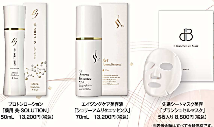
プロトンローション 「薬用美-SOLUTION」 150mL 13,200円(税込)

「抗酸化」「保湿」「栄養補給」「肌力UP」の4つのアプローチで、夏の肌ダメージのリセットに働きかけるスキンケアセット。5日間、集中的にご使用いただくことで、ダメージケアだけでなく、理想的な肌コンディションとリフトアップ実感も実現!