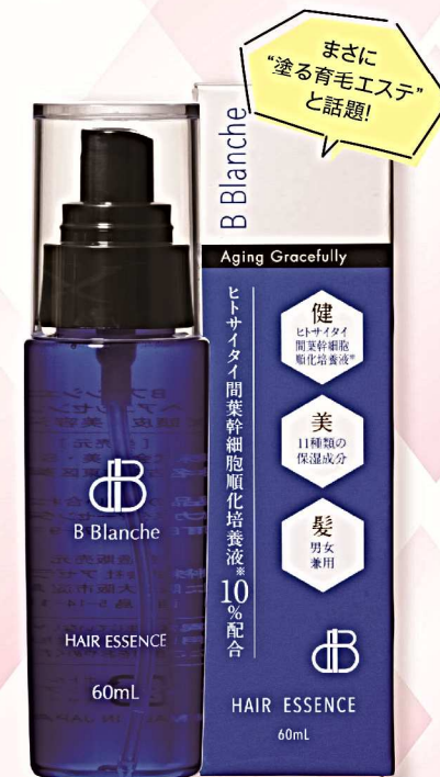
B Blanche HAIR ESSENCE (育毛剤) 1本 60mL 14,850円(税込)