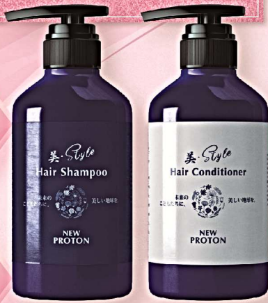
美・Style Hair Shampoo / Hair Conditioner 各500mL 各8,800円(税込) ※表示金額はすべて美・Style会員価格です

汚れを洗い流すのではなく、なんと“還元”しちゃう魔法の成分プロトンによって、毛髪の土台である頭皮環境から健美髪状態へと導く、日本で唯一のプロトンヘアケア製品『美・Style Hair Shampoo&Hair Conditioner』。根元から健やかに整える設計なので、クタクタとしてハリのない毛髪も、手櫛だけでフワッと立ち上がる理想髪へ!