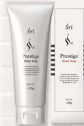
Śrī Prestige Blanc Soap 120g 13,200円(税込) ※表示価格は会員価格です

一度使うと、洗い上がりの肌コンディションの違いに愛用者が続出する、ヒト幹細胞培養液配合「Śrī Prestige Blanc Soap」。その使い方が今話題に!