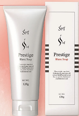
Śrī Prestige Blanc Soap 120g 13,200円(税込) ※表示価格は会員価格です

花粉の付着により、デリケートになっている肌をやさしく労りながら洗い上げる「Śrī Prestige Blanc Soap(シュリープレステージ ブランソープ)」。 ヒト幹細胞培養液やプラセンタなどの主役級美容成分配合で、角層の水分量や油分のバランスの乱れをケアして、健やかな肌へと導きます。