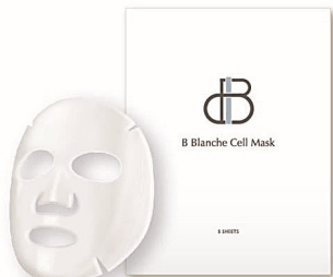
B Blanc Cell Mask(シートマスク) 1枚(美容液23mL)×5袋8,800円(税込) ※表示価格は会員価格です

ヒト幹細胞培養液と先進成分DMAEを配合した、10分で集中エステを叶えるシートマスク。感動レベルの集中保湿が叶うから、エステに通ったりしてフェイシャルケアを受けずともインナードライ対策が完結。5日間続けて使えば、肌コンディションの変化を実感できると話題のアイテムです。